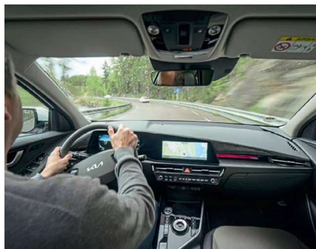
Übersichtlich: Cockpit mit Doppelbildschirm und reduzierter Tastenzahl.

Aufgefrischt: Ähnliche Grundform, aber neue Details wie die C-Säule in Kontrastfarbe.