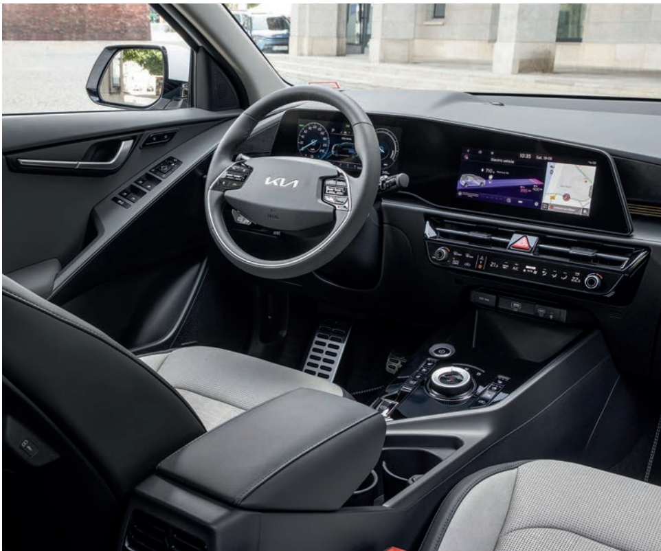
Der neue Kia Niro EV ist mit technologisch fortschrittlichen Funktionen ausgestattet, die für eine umfassende Konnektivität sorgen.

Die Batteriekapazität steigt leicht von 64 auf 64,8 kWh, die maximale Reichweite um 8 auf 463 Kilometer. In der City rollen Sparfüchse über 600 Kilometer mit einer Ladung – sagt Kia. Auch ziemlich klug: Um die Ladezeit zu verkürzen, lässt sich der Akku vorkonditionieren. ▶